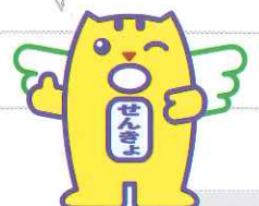
選挙のめいすいくん (明るい選挙のイメージキャラクター)

18歳 選挙権について 日本の未来を担う若い世代の声をより政治に取り入れるため、70年ぶりに法律が改正されて、平成28年7月に行われた参議院議員通常選挙から選挙権年齢が18歳以上に引き下げられました!!