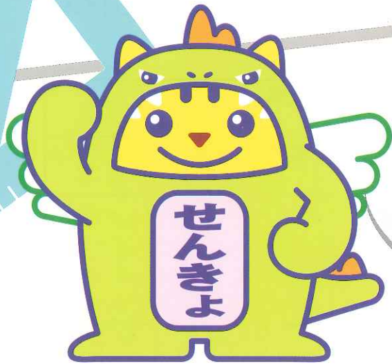
めいすいサウルス (福井県ご当地めいすいくん)

みんなが投票に行きたくなるような キャッチフレーズや標語を募集するよ。 たくさん応募してね!